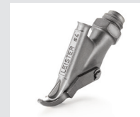
Zieldüse mit Heftschnabel, rund, Ø 4 mm Artikel-Nr.: 113.399