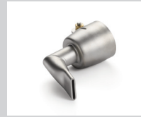
Winkeldüse 20 mm, 90° abgewinkelt Artikel-Nr.: 107.124