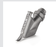
Zieldüse ohne Heftschnabel, rund, Ø 3 mm Artikel-Nr.: 113.876