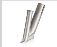
Schnellschweißdüse, mit schmalen Luftschlitz, Ø 4 mm * Artikel-Nr.: 105.432