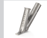
Schnellschweißdüse, Dreiecksprofil 7 mm * Artikel-Nr.: 106.993