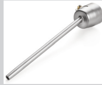
Verlängerungsdüse Ø 5 mm, 150 mm Artikel-Nr.: 106.982