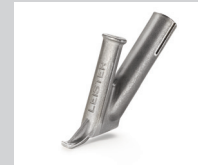
Schnellschweißdüse, Dreiecksprofil 5.7 mm * Artikel-Nr.: 106.992