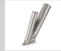
Schnellschweißdüse Ø 4 mm * Artikel-Nr.: 106.990