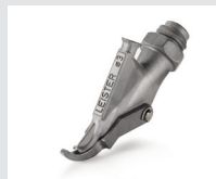
Zieldüse mit Heftschnabel, rund, Ø 3 mm Artikel-Nr.: 113.666