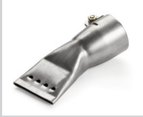
Breitschlitzdüse 40 mm, gelocht Artikel-Nr.: 107.133