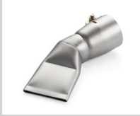
Breitschlitzdüse 40 mm, 60° gebogen Artikel-Nr.: 107.130