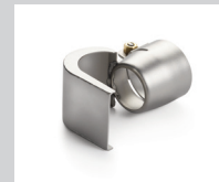
Löffelreflektor 27 x 35 mm Artikel-Nr.: 107.307