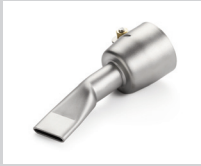
Breitschlitzdüse 20 mm, gebogen, nicht abgewinkelt Artikel-Nr.: 107.123

TRIAC PID / S, DIODE PID / S, aufschiebbar