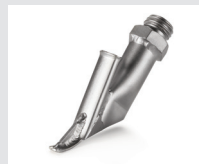
Zieldüse ohne Heftschnabel, Dreiecksprofil, 7 mm Artikel-Nr.: 106.986

* zu benutzen mit 100.303 / 105.578 / 106.982 / 105.622