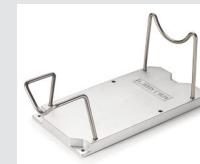
Geräteablage Artikel-Nr.: 107.348

* zu benutzen mit 100.303 / 105.578 / 106.982 / 105.622