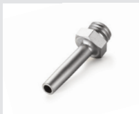
Rohrdüse Ø 5 mm Artikel-Nr.: 105.622