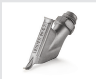
Zieldüse ohne Heftschnabel, Dreiecksprofil, 5.7 mm Artikel-Nr.: 113.877