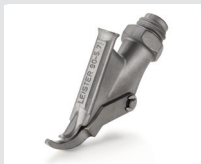
Zieldüse mit Heftschnabel, Dreiecksprofil, 5.7 mm Artikel-Nr.: 113.670