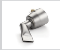
Winkeldüse 20 mm, 60° abgewinkelt Artikel-Nr.: 107.125