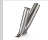
Schnellschweißdüse, mit schmalen Luftschlitz, Ø 5 mm * Artikel-Nr.: 105.433