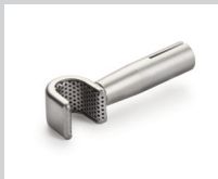
Siebreflektor (Ø 8.25 mm), 10 x 12 mm * Artikel-Nr.: 107.324