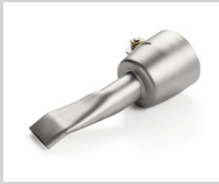
Breitschlitzdüse 20 mm, gebogen und abgewinkelt Artikel-Nr.: 105.487