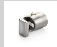
Lötreflektor 17 x 34 mm Artikel-Nr.: 107.339