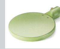
Schweisspiegel 135 mm, PTFE-beschichtet Artikel-Nr.: 107.344