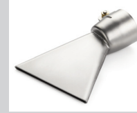
Breitschlitzdüse 80 mm, für Bitumen Artikel-Nr.: 107.131