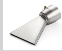
Breitschlitzdüse 60 mm, für Bitumen Artikel-Nr.: 107.129