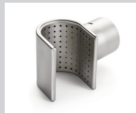
Siebreflektor 50 x 35 mm Artikel-Nr.: 107.337