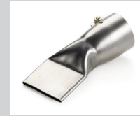
Breitschlitzdüse 40 mm Artikel-Nr.: 107.132