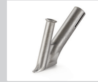
Schnellschweißdüse Ø 3 mm * Artikel-Nr.: 106.989