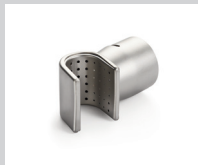
Siebreflektor 35 x 20 mm Artikel-Nr.: 107.338