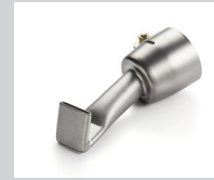
Breitschlitzdüse 20 mm, gerader Schnabel, 120° abgekröpft Artikel-Nr.: 105.492