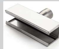
Siebreflektor 25 x 150 mm Artikel-Nr.: 107.326