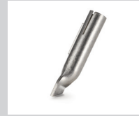
Heftdüse * Artikel-Nr.: 106.996