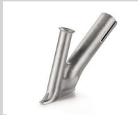
Schnellschweißdüse, mit schmalen Luftschlitz, Ø 3 mm * Artikel-Nr.: 105.431