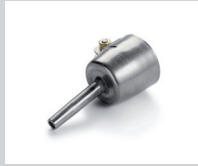
Rohrdüse Ø 5 mm, verstärkt Artikel-Nr.: 105.578