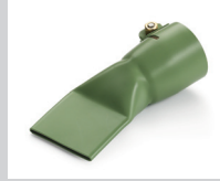
Breitschlitzdüse 40 mm, PTFE-beschichtet Artikel-Nr.: 107.135