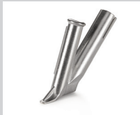
Schnellschweißdüse Ø 5 mm * Artikel-Nr.: 106.991