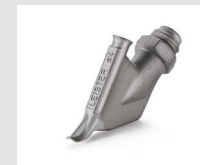
Zieldüse ohne Heftschnabel, rund, Ø 4 mm Artikel-Nr.: 113.874