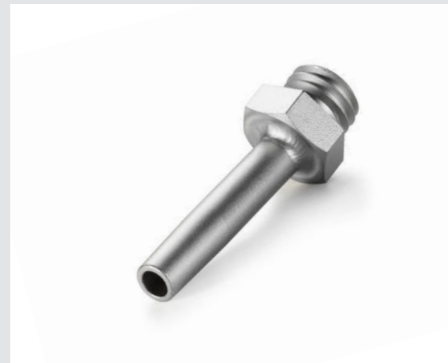
Rohrdüse Ø 5 mm Artikel-Nr.: 105.622