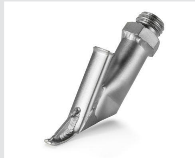
Ziehdüse ohne Heftschnabel, Dreiecksprofil, 7 mm Artikel-Nr.: 106.986