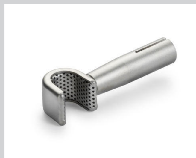
Siebreflektor (Ø 8.25 mm), 10 x 12 mm * Artikel-Nr.: 107.324