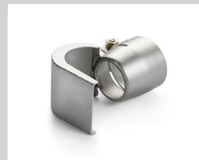
Löffelreflektor 27 x 35 mm Artikel-Nr.: 107.307