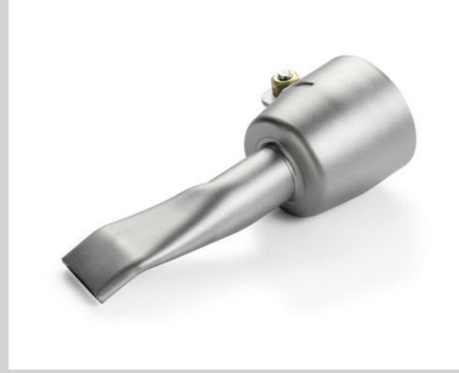
Breitschlitzdüse 20 mm, gebogen und abgewinkelt Artikel-Nr.: 105.487