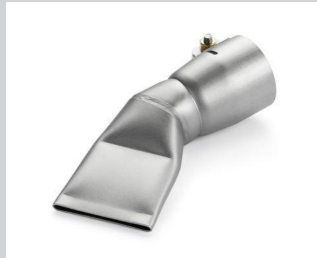
Breitschlitzdüse 40 mm, 60° gebogen Artikel-Nr.: 107.130