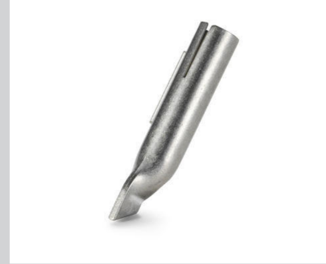
Heftdüse * Artikel-Nr.: 106.996