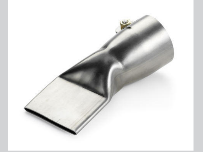
Breitschlitzdüse 40 mm Artikel-Nr.: 107.132