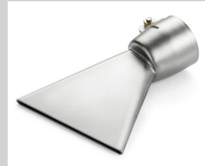
Breitschlitzdüse 80 mm, für Bitumen Artikel-Nr.: 107.131