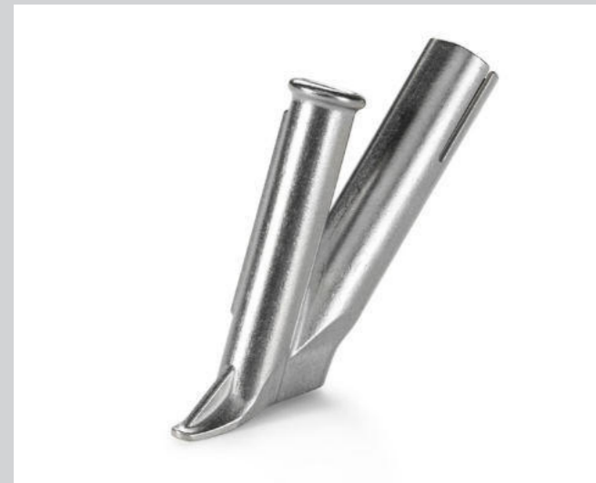
Schnellschweissdüse Ø 5 mm * Artikel-Nr.: 106.991 / 156.470 gebogen