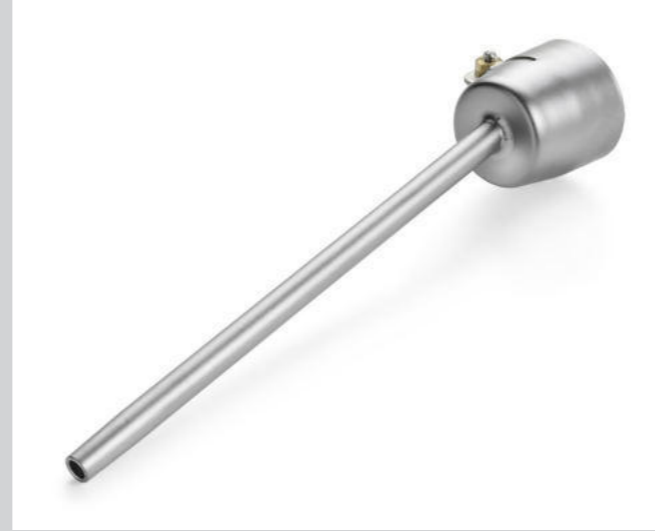
Verlängerungsdüse Ø 5 mm, 150 mm Artikel-Nr.: 106.982