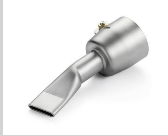
Breitschlitzdüse 20mm, abgewinkelt Artikel-Nr.: 107.123

TRIAC AT / ST, DIODE PID / S, aufschiebbar