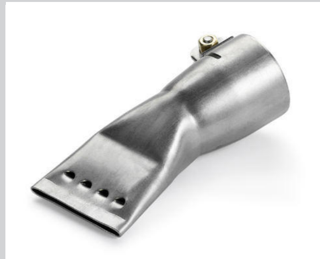
Breitschlitzdüse 40 mm, gelocht Artikel-Nr.: 107.133