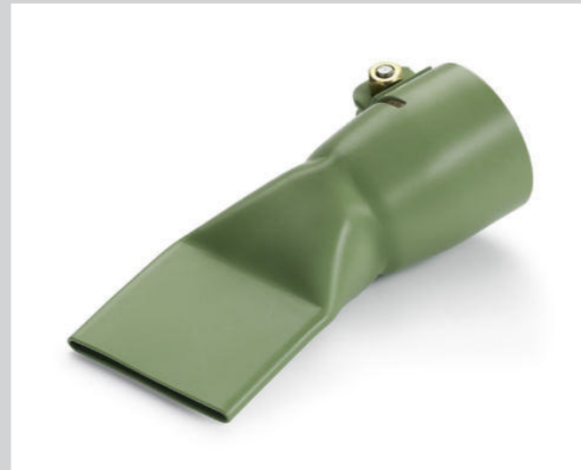
Breitschlitzdüse 40 mm, PTFE-beschichtet Artikel-Nr.: 107.135