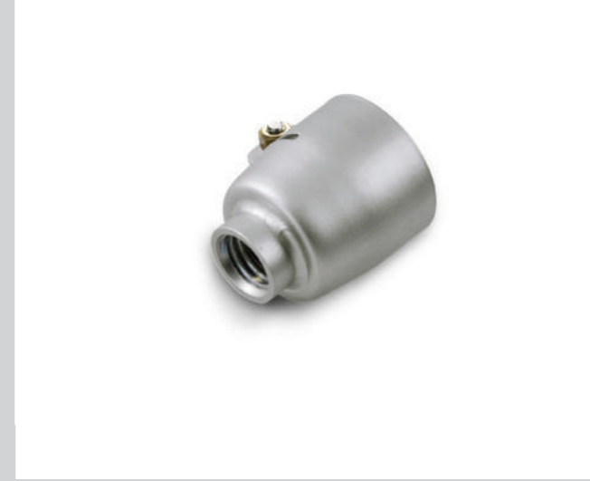
Düsenadapter Ø 31.5 mm zu M14 Gewinde (Schraubdüsen) Artikel-Nr.: 143.833