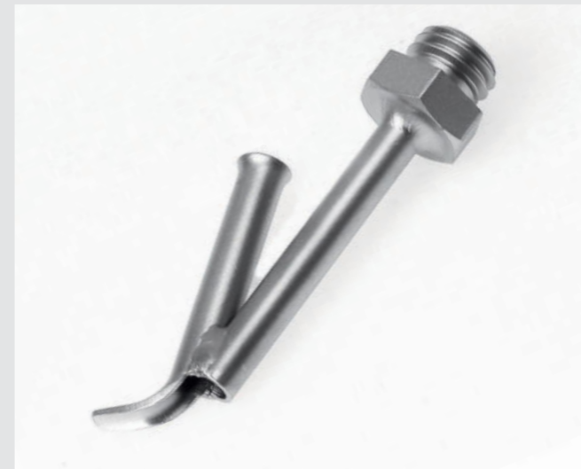
Ziehdüse, für Fluoroplastics Ø 4 mm Artikel-Nr.: 126.552