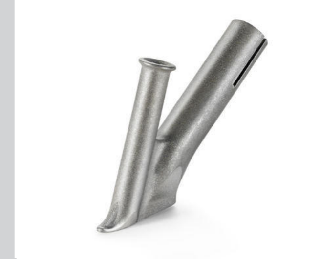
Schnellschweissdüse Ø 3 mm * Artikel-Nr.: 106.989