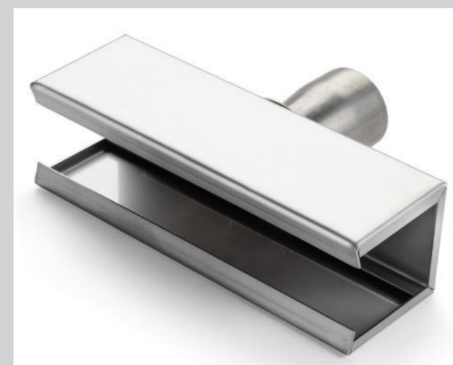
Schalenreflektor 25 x 150 mm Artikel-Nr.: 107.326