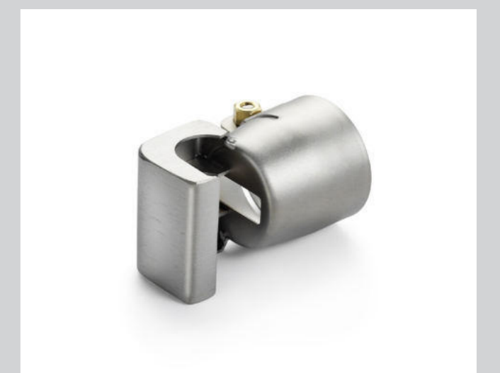
Lötreflektor 17 x 34 mm Artikel-Nr.: 107.339