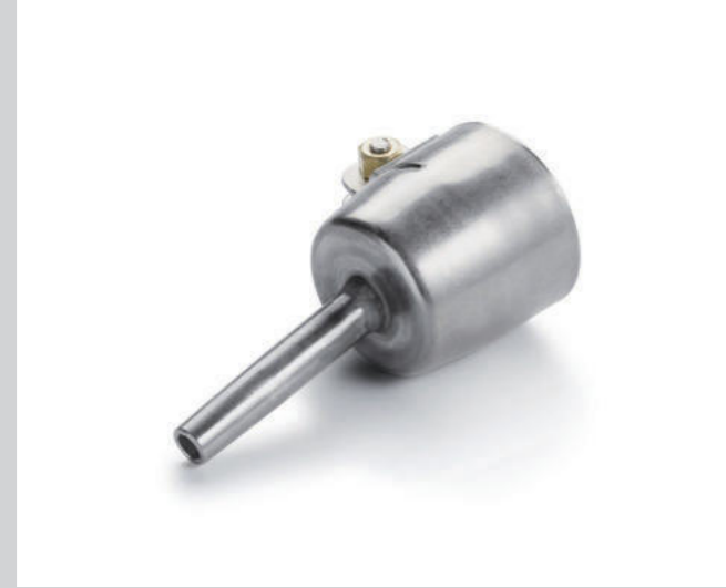
Rohrdüse Ø 5 mm Artikel-Nr.: 100.303