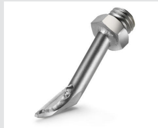
Heftziehdüse Artikel-Nr.: 106.988