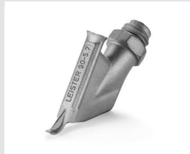
Ziehdüse ohne Heftschnabel, Dreiecksprofil, 5.7 mm Artikel-Nr.: 113.877