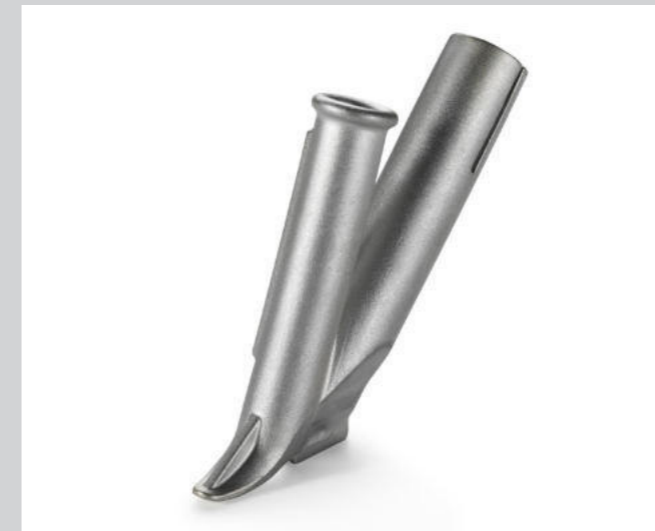
Schnellschweissdüse, mit schmalen Luftschlitz, Ø 5 mm * Artikel-Nr.: 105.433