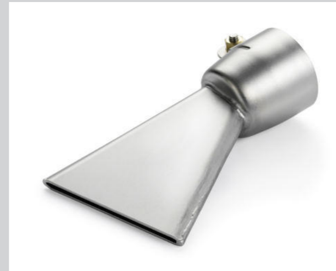
Breitschlitzdüse 60 mm, für Bitumen Artikel-Nr.: 107.129