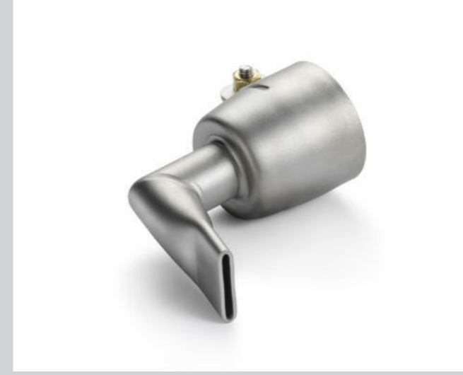
Winkeldüse 20 mm, 90° abgewinkelt Artikel-Nr.: 107.124