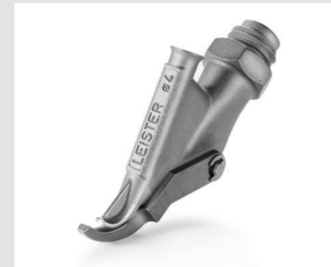
Ziehdüse mit Heftschnabel, rund, Ø 4 mm Artikel-Nr.: 113.399