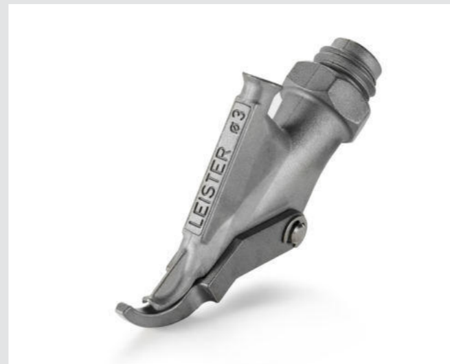
Ziehdüse mit Heftschnabel, rund, Ø 3 mm Artikel-Nr.: 113.666