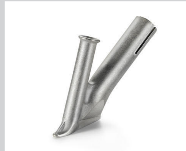
Schnellschweissdüse, mit schmalen Luftschlitz, Ø 3 mm * Artikel-Nr.: 105.431