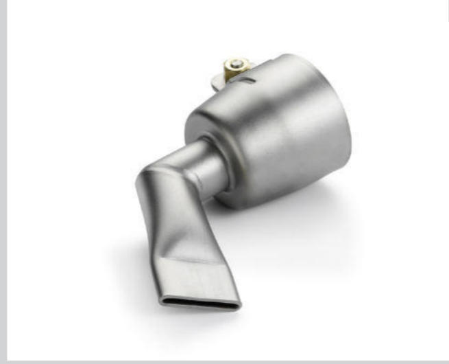
Winkeldüse 20 mm, 60° abgewinkelt Artikel-Nr.: 107.125 (rechts) Artikel-Nr.: 105.503 (links)