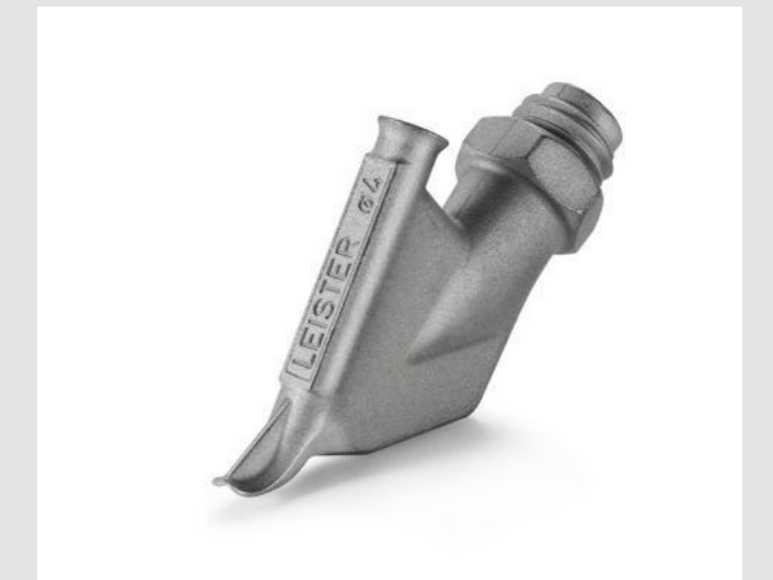
Ziehdüse ohne Heftschnabel, rund, Ø 4 mm Artikel-Nr.: 113.874