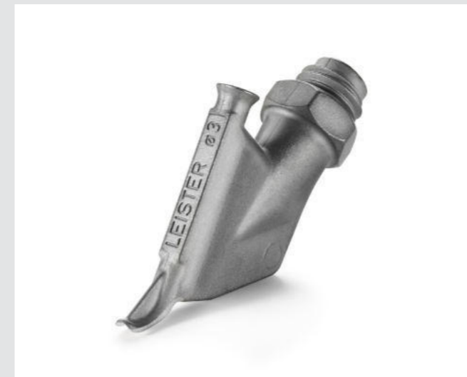
Ziehdüse ohne Heftschnabel, rund, Ø 3 mm Artikel-Nr.: 113.876