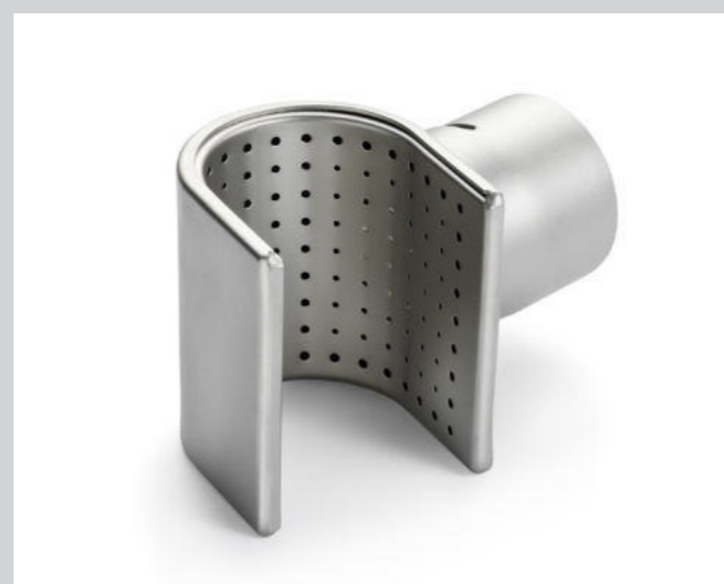
Siebreflektor 50 x 35 mm Artikel-Nr.: 107.337