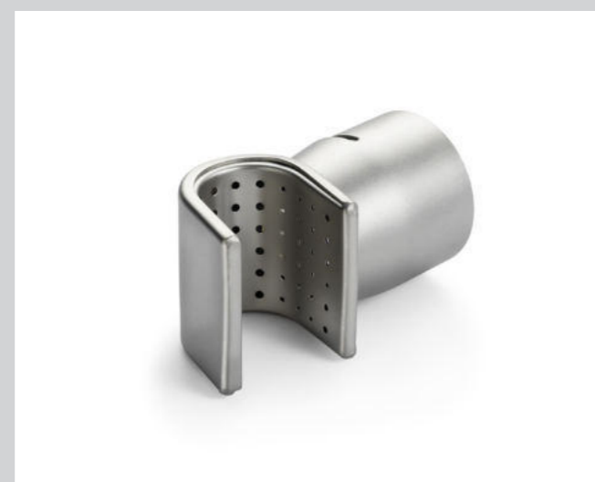
Siebreflektor 35 x 20 mm Artikel-Nr.: 107.338