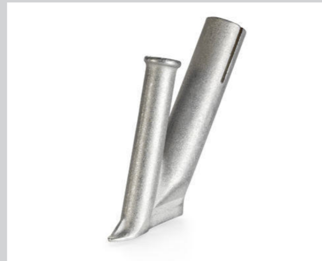
Schnellschweissdüse, mit schmalen Luftschlitz, Ø 4 mm * Artikel-Nr.: 105.432