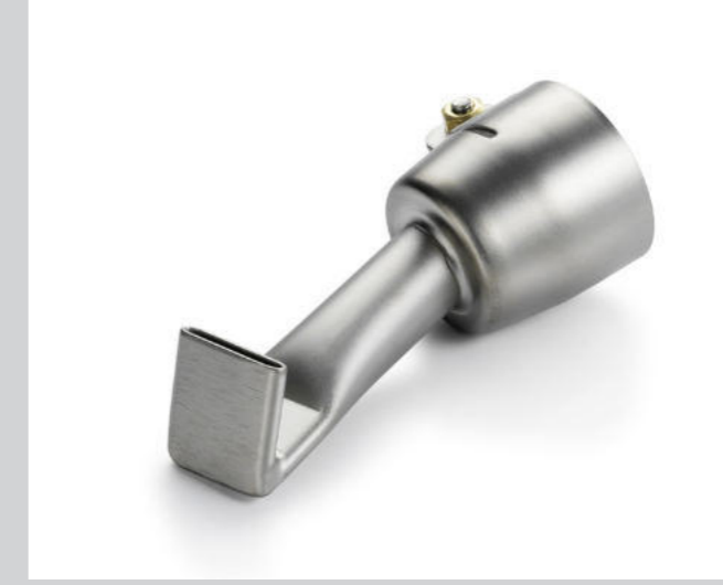
Breitschlitzdüse 20 mm, gerader Schnabel, 120° abgekröpft Artikel-Nr.: 105.492