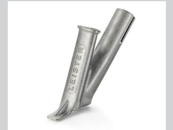
Schnellschweissdüse, Dreiecksprofil 7 mm * Artikel-Nr.: 106.993