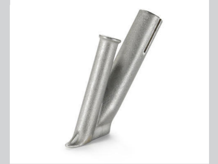
Schnellschweissdüse Ø 4 mm * Artikel-Nr.: 106.990