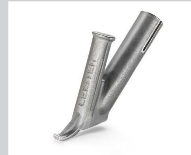
Schnellschweissdüse, Dreiecksprofil 5.7 mm * Artikel-Nr.: 106.992