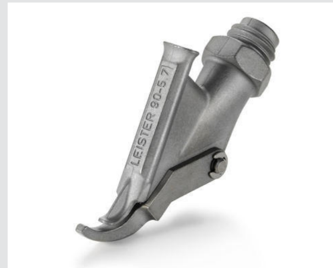
Ziehdüse mit Heftschnabel, Dreiecksprofil, 5.7 mm Artikel-Nr.: 113.670