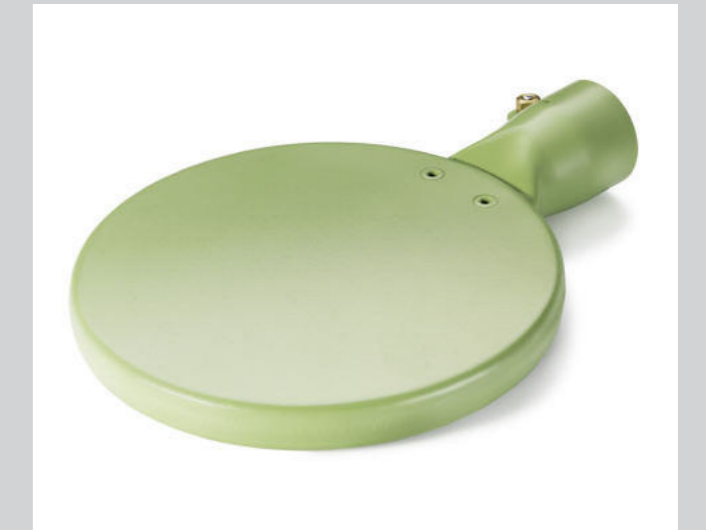
Schweissspiegel 135 mm, PTFE-beschichtet Artikel-Nr.: 107.344