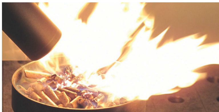
Sauberer Zündvorgang durch optimale Hitze.

Gehäuse, der frei konfigurierbare Gerätestecker und der Luftschlauch-Anschlussadapter mit 1"-Innengewinde sind weitere innovative Massnahmen für einen optimalen Einbau in Heizkessel aller Kategorien.