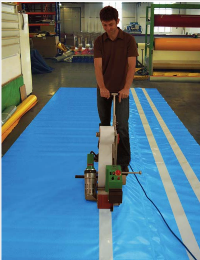
Intuitive Bedienung und einfachstes Handling