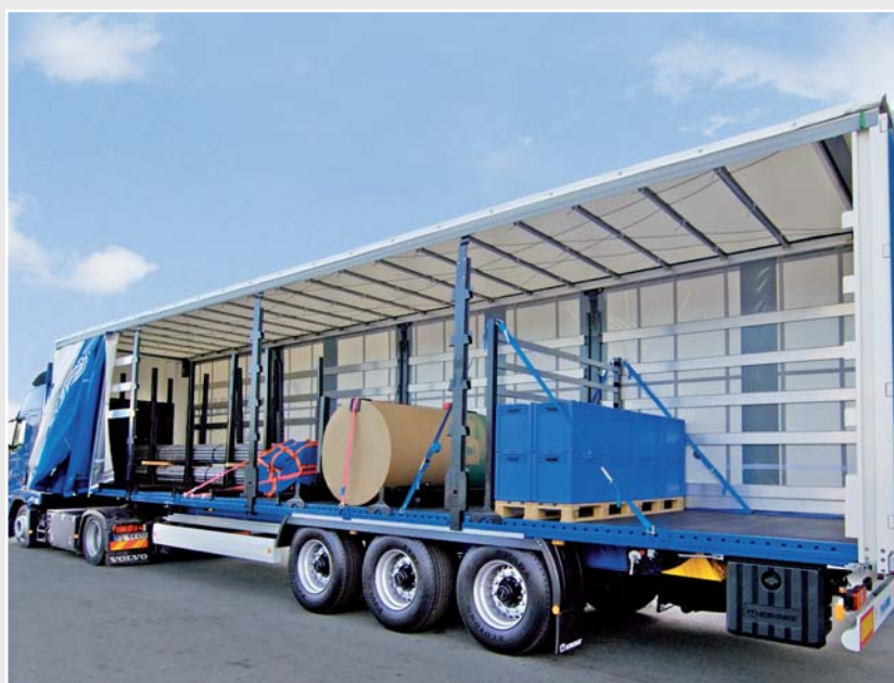
Verstärkungsstreifen für Fest- und Schiebeverdecke von LKW-Planen.