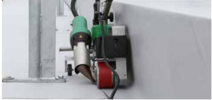
Mühelos schweisst der UNIROOF auch alle schwer zugänglichen „Dach-Problemzonen“

ebenso mühelos alle schwer zugänglichen „Dach-Problemzonen“. Mit 3450W Leistung, 230V und 15 Ampere im Kasten bietet er temporeiche Höchstleistungen auf jedem Dach.